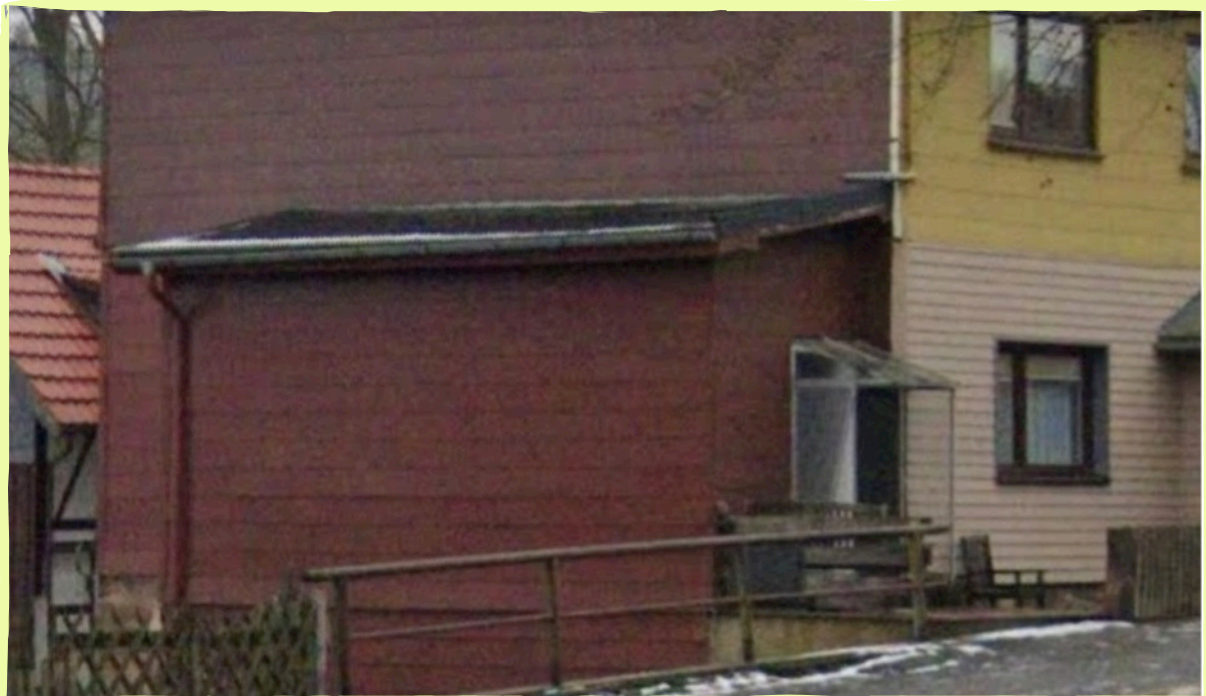
Das Foto zeigt den früheren Milch-Meier - Anbau

Mit unserer alten Blechkanne mit Metallbügel/Holzgriff kein Problem, aber mit unserer 60er-Jahre Plastikkanne in Tropfenform mit orangem Deckel und Henkel ist mir bei einem Stunt der T- förmige Pips an der Kanne abgerissen, was zuhause echt Ärger einbrachte.